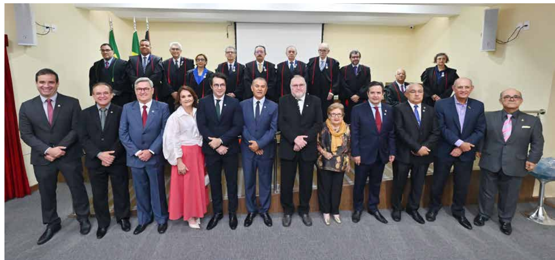
Conselheiros e agraciados posam antes da solenidade

Instituída em 2023, a concessão anual da Medalha do Mérito transformou-se em um evento tradicional na cidade, com a participação de autoridades e representantes dos mais variados estratos sociais.