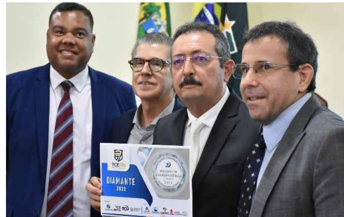
Pelo segundo ano, TCE é contemplado com o selo diamante de transparência