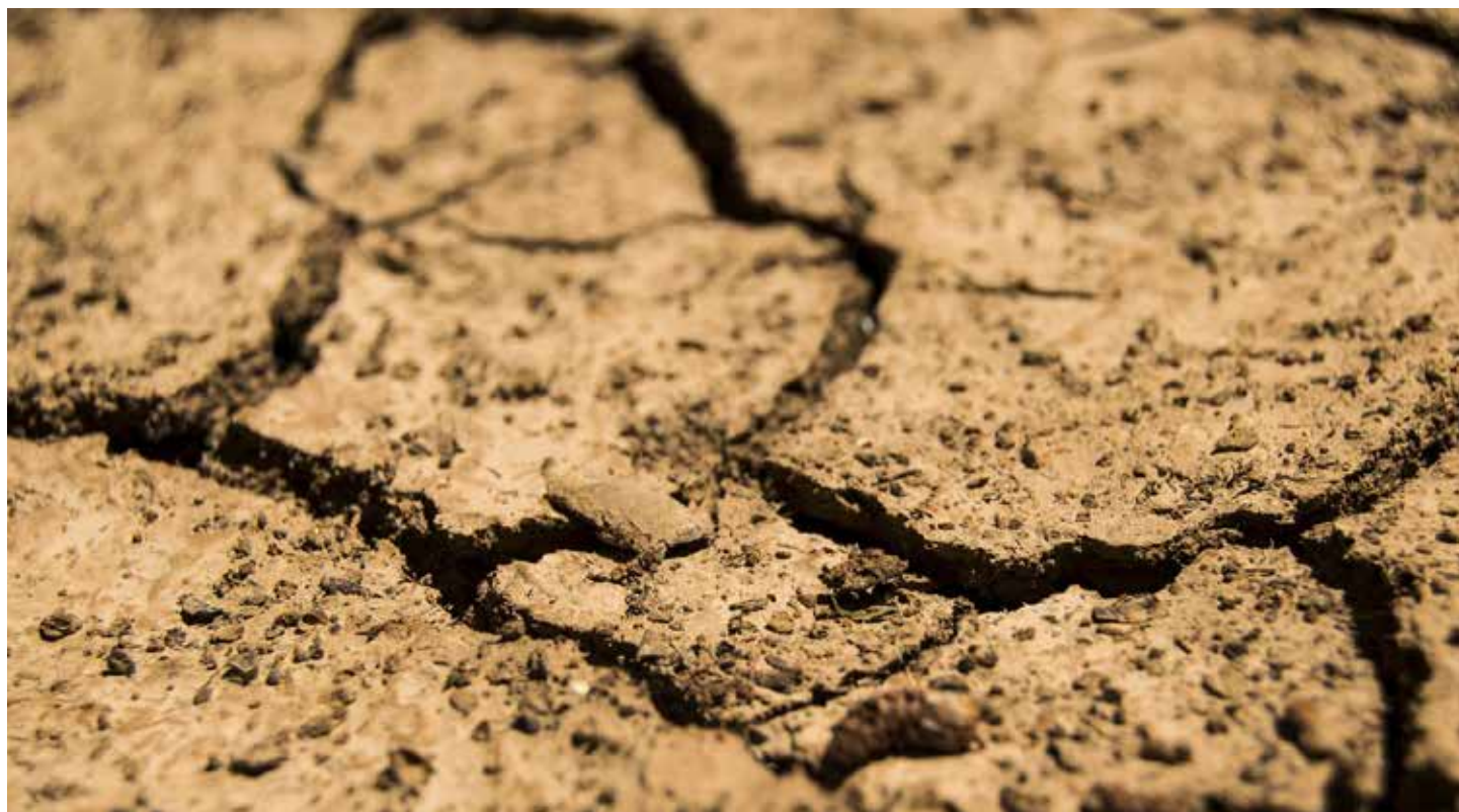
Política de combate à desertificação é alvo de fiscalização de vários TCs do Nordeste

Auditoria operacional do Tribunal de Contas do Estado (TCE/RN) identificou que o Rio Grande do Norte não implantou a Política Estadual de Combate à Desertificação. A Política Estadual foi instituída em 2017, mas não teve os termos colocados em prática pelo governo do estado. A auditoria destaca uma série de deficiências que comprometem a eficácia das ações no RN e traz 29 recomendações para os entes públicos responsáveis pelo combate à desertificação.