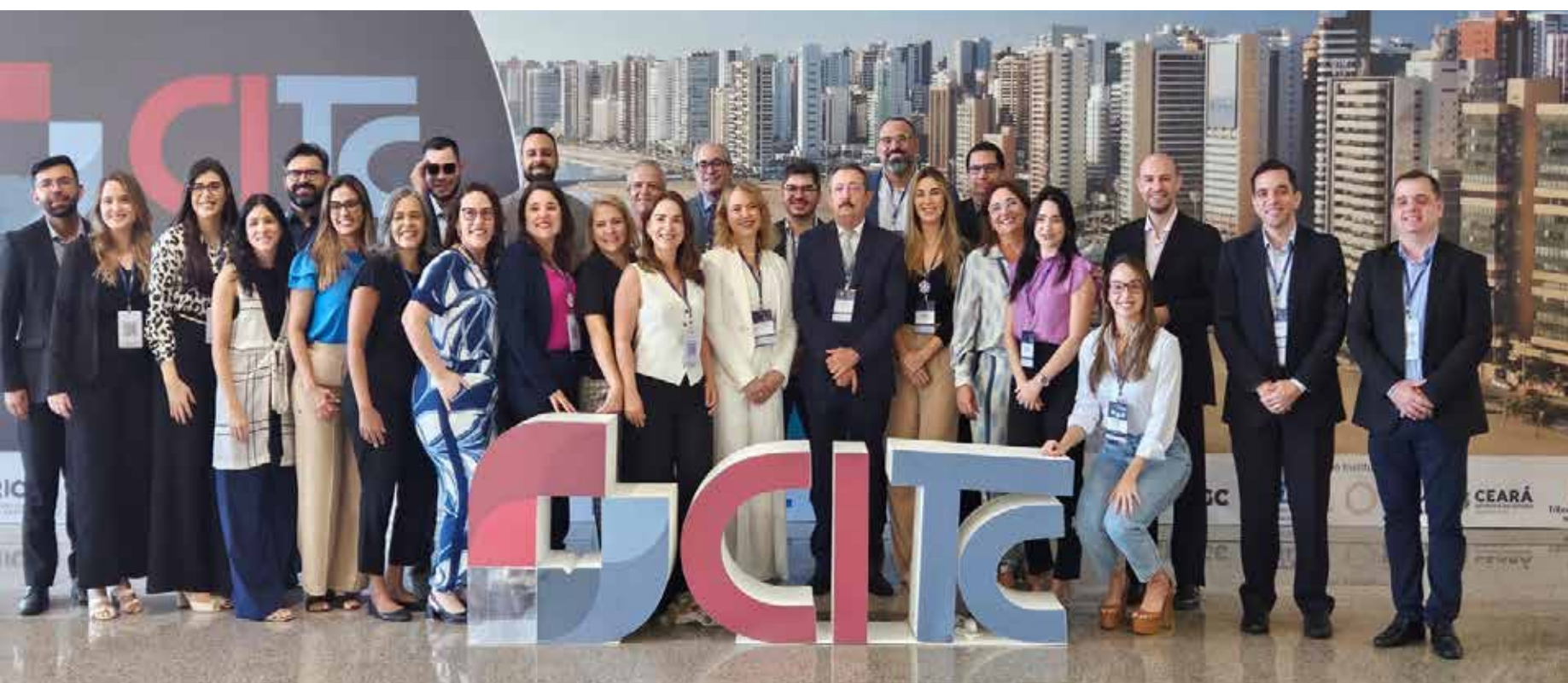
Delegação do TCE potiguar em Fortaleza

O apoio é da Associação Nacional do Ministério Público de Contas (AMPCON), do Conselho Nacional dos Procuradores-Gerais de Contas (CNPGC), da Confederação Nacional da Indústria (CNI), do Instituto Dragão do Mar, das Secretarias da Cultura e do Turismo do Estado do Ceará e do Tribunal de Contas do Estado do Mato Grosso (TCE-MT).