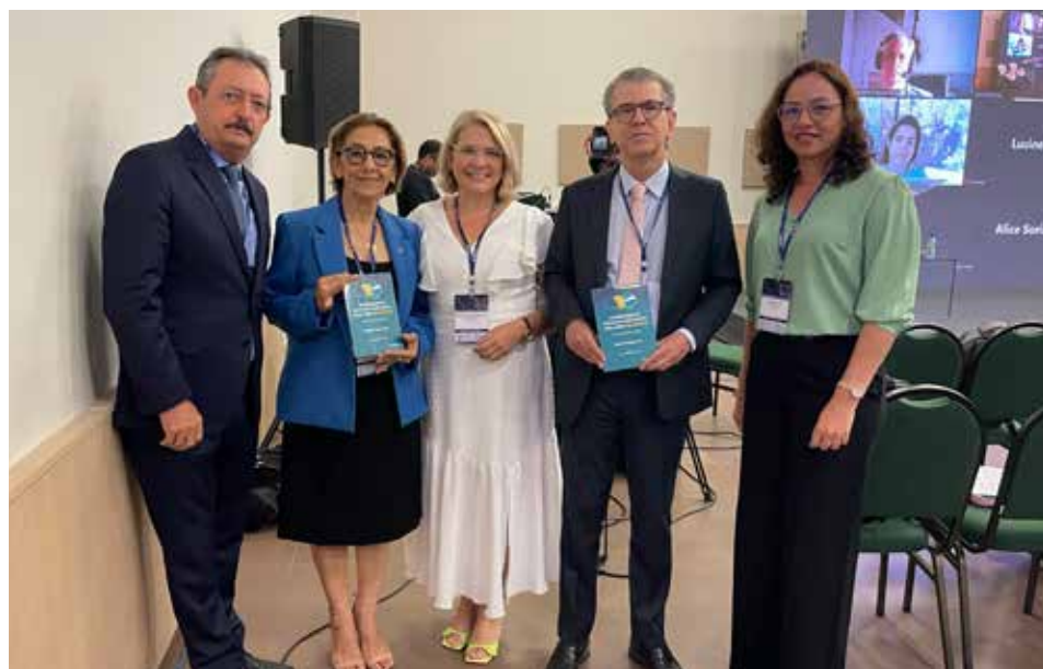
Conselheiros e servidores do TCE em encontro no Ceará