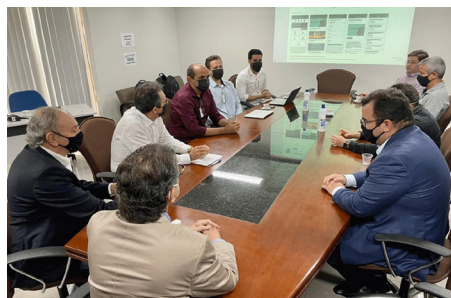
Com o aplicativo, o cidadão terá acesso facilitado e rápido as informações

“É mais um canal de comunicação e interação, vai facilitar a conexão com o público”, opinou o conselheiro Tarcísio Costa. “É uma via mais fácil para ter acesso aos serviços e informações”, destacou o conselheiro Gilberto Jales.