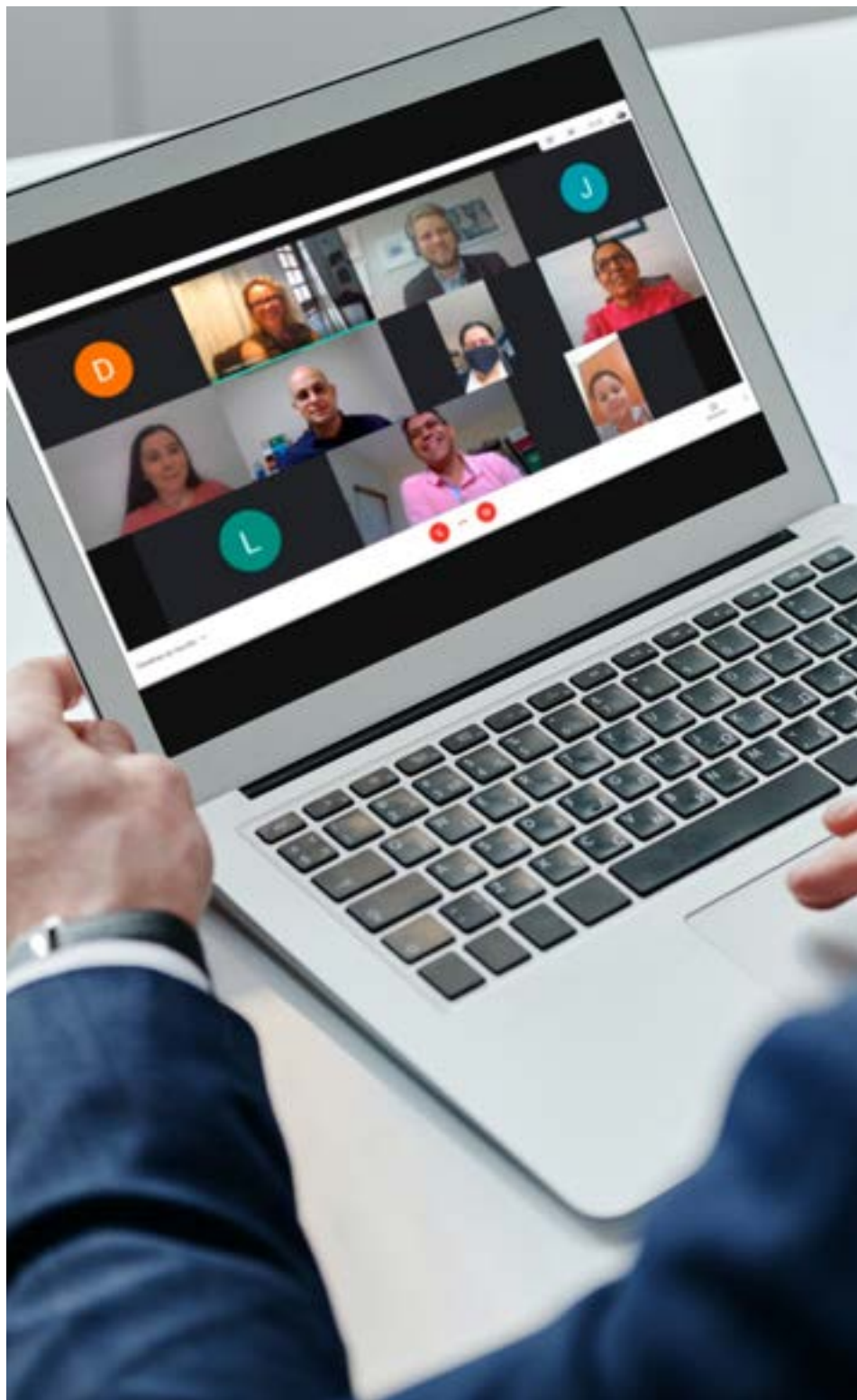
Ministério Público de Contas comemora resultados do projeto #HashTAG Sustentabilidade

Os trabalhos no âmbito do projeto #HashTAG Sustentabilidade estão sendo retomados em que serão avaliados os Municípios de Currais Novos (em processo avançado de negociações), Caicó e Mossoró.