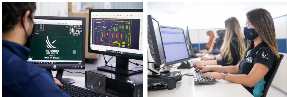
Figura 6 – Equipe de Engenharia e Desenvolvimento de Sistemas

A AUTOTRAC possui uma equipe própria de engenharia e desenvolvimento de sistemas composta por cerca de 80 profissionais entre engenheiros, analistas de sistemas, técnicos em eletrônica e programadores, que será responsável por atender as novas demandas do TRIBUNAL DE CONTAS/RN, implementação de novas funcionalidades, alteração de parâmetros de rede, novas integrações, simulações, estudos etc.