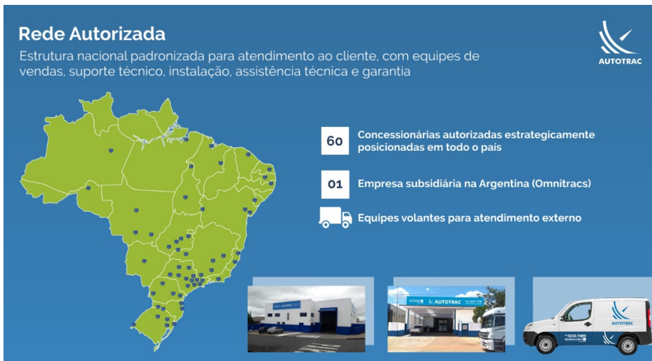
Figura 5 – Rede Autorizada de Atendimento ao Cliente