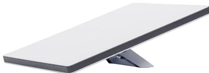
Figura 3- Starlink mini