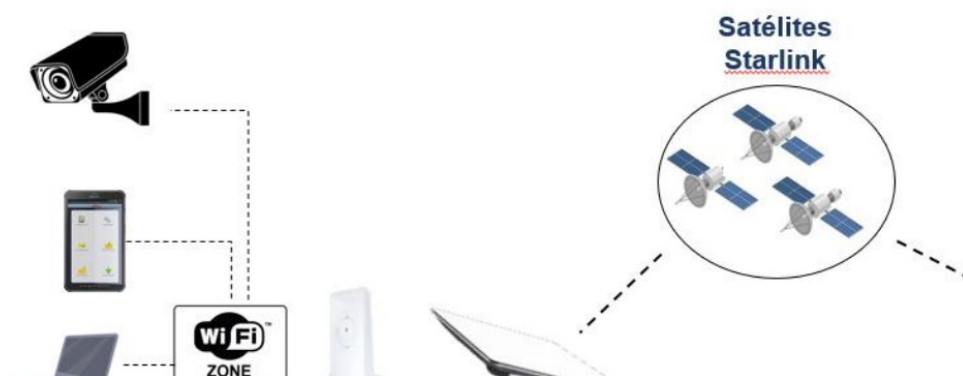
Figura 1 – Arquitetura resumida da solução

Sistema de comunicação de dados padrão IP via satélite baseado em uma rede de aproximadamente 5.000 satélites de baixa órbita (LEO), com altas taxas de transmissão, baixa latência e banda larga.